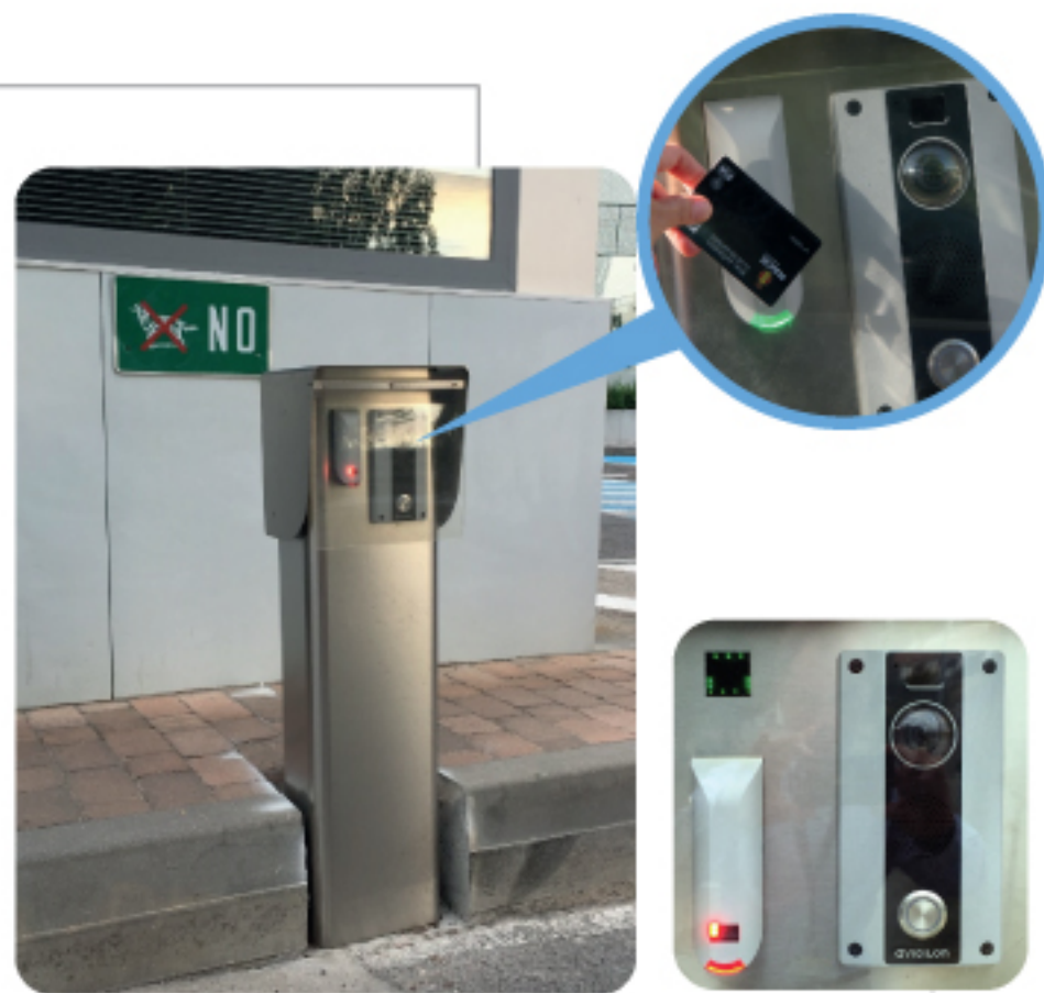
LECTOR Y VIDEOPORTERO

Al pasar la tarjeta o el código QR la luz será roja (acceso denegado) o verde (acceso permitido.)