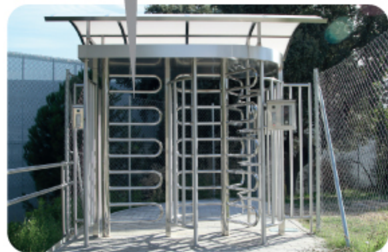
ACCESO PEATONAL CAMPO DE FÚTBOL / HOCKEY